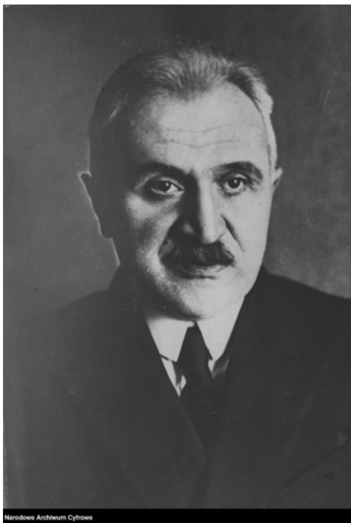
Wacław Berent (1873 – 1940)

Na okładce Programu wykorzystano: Anna Berent (1871 – ok. 1944), Scena symboliczna na tle morza (1929)